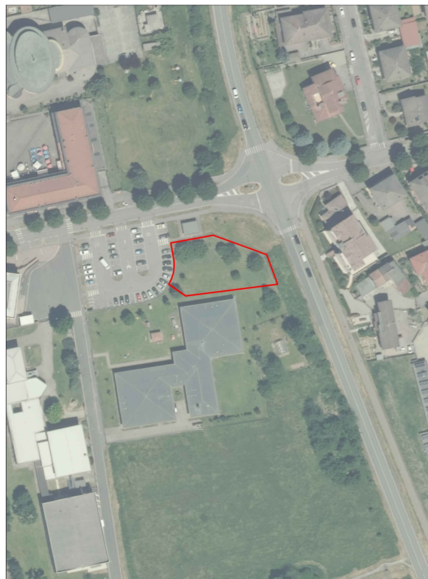
individuazione lotto intervento su ortofoto - scala 1:1'000