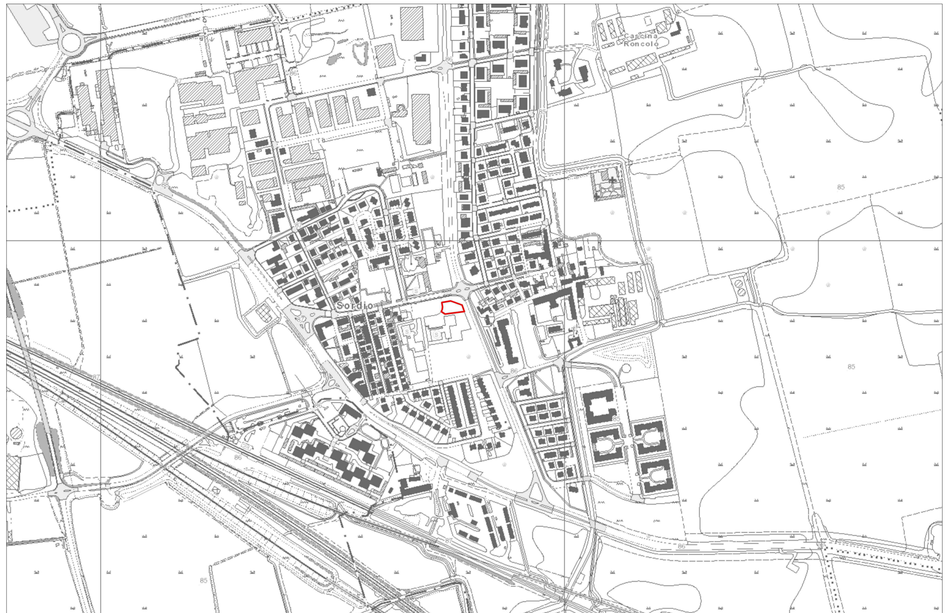
inquadramento data base cartografico b/n. - scala 1:5'000